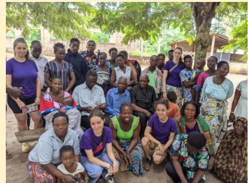
Sensibilisations sur l'orthophonie