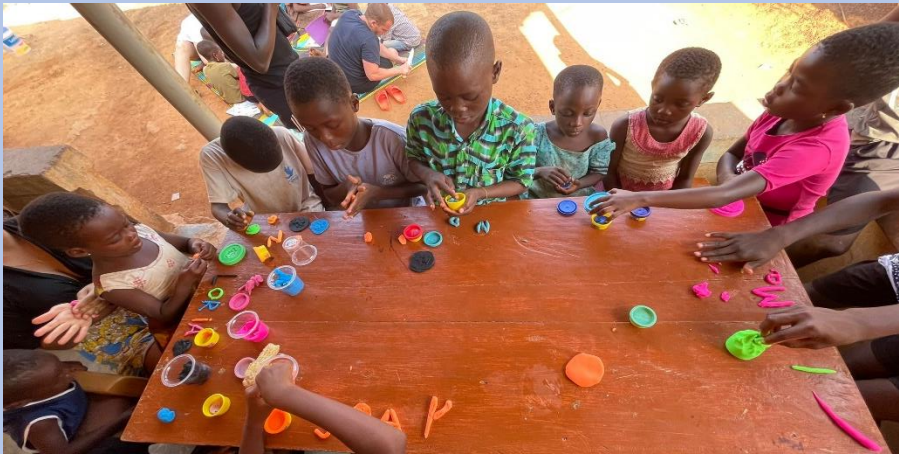
Jeux socio-éducatifs avec les enfants du village