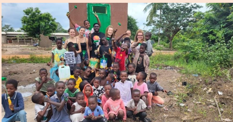
Atelier peinture des latrines

Liste des dons : Les bénévoles ont distribué du matériel scolaire (cahiers, stylos, crayons, gommes), des livres de lecture et manuels scolaires, du matériel médical (pansements, machine de pèse-bébés, médicaments...).