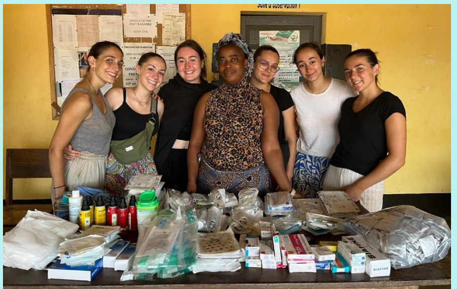
Distribution et sensibilisation sur la santé