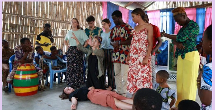
Sensibilisation aux gestes de premiers secours