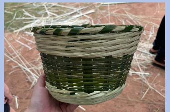
Atelier fabrication de paniers