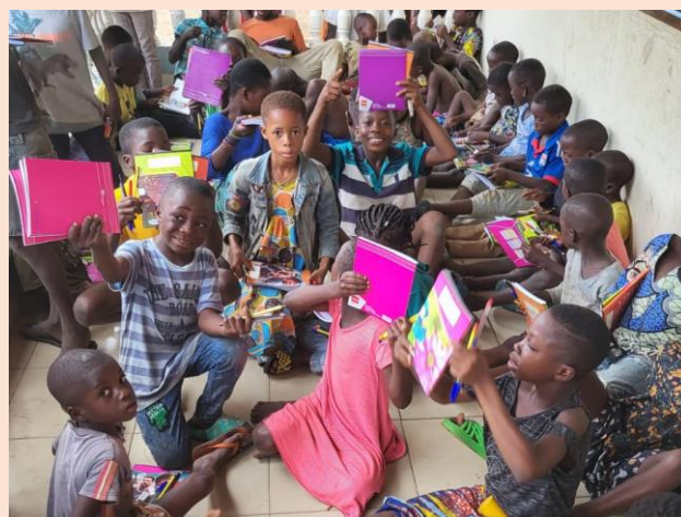
Soutien scolaire et jeux socio-éducatifs avec les enfants