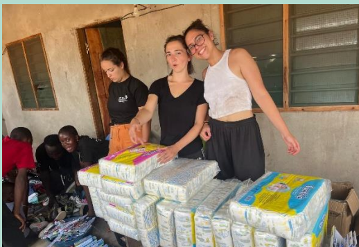
Distribution de matériel de santé et scolaire pour les enfants et adultes de Tovegan