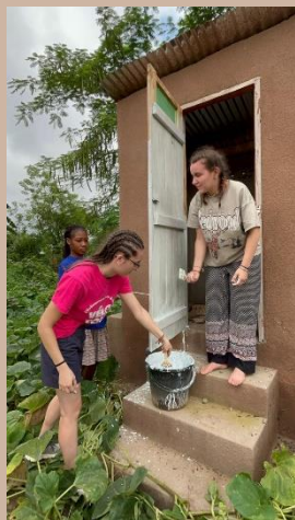
Peinture des latrines