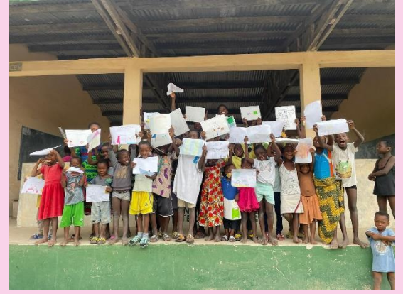
Atelier échange de dessins