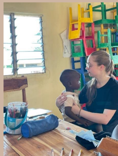
Jeux socio-éducatifs avec les enfants