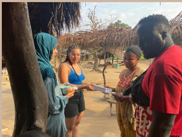
Distribution dans le village