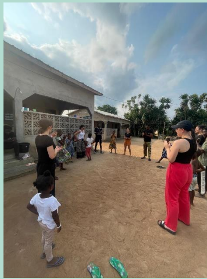
Jeux et sport avec les enfants