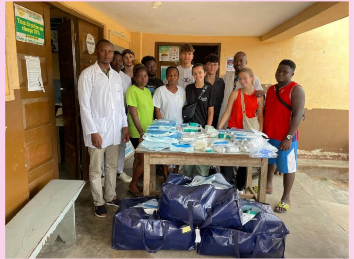
Distribution du matériel scolaire et médical