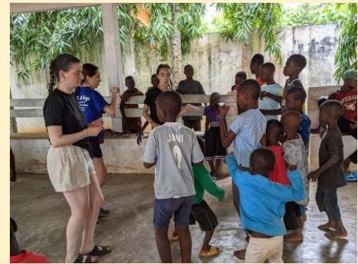
Jeux socio-éducatifs avec les enfants