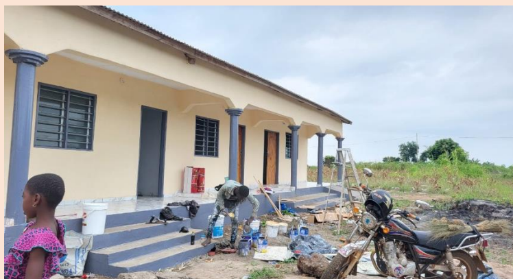
Désherbage du centre de jeunes à Tovegan