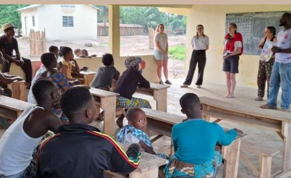
Sensibilisations sur l'orthophonie