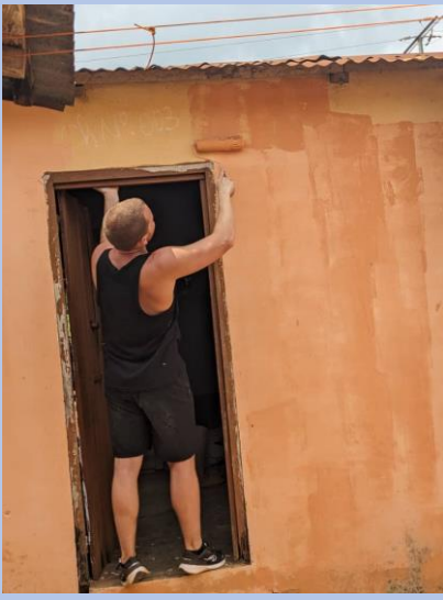
Atelier peinture et rénovation