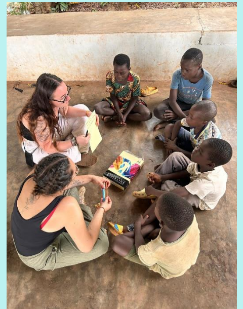
Soutien scolaire et jeux socio-éducatifs avec les enfants