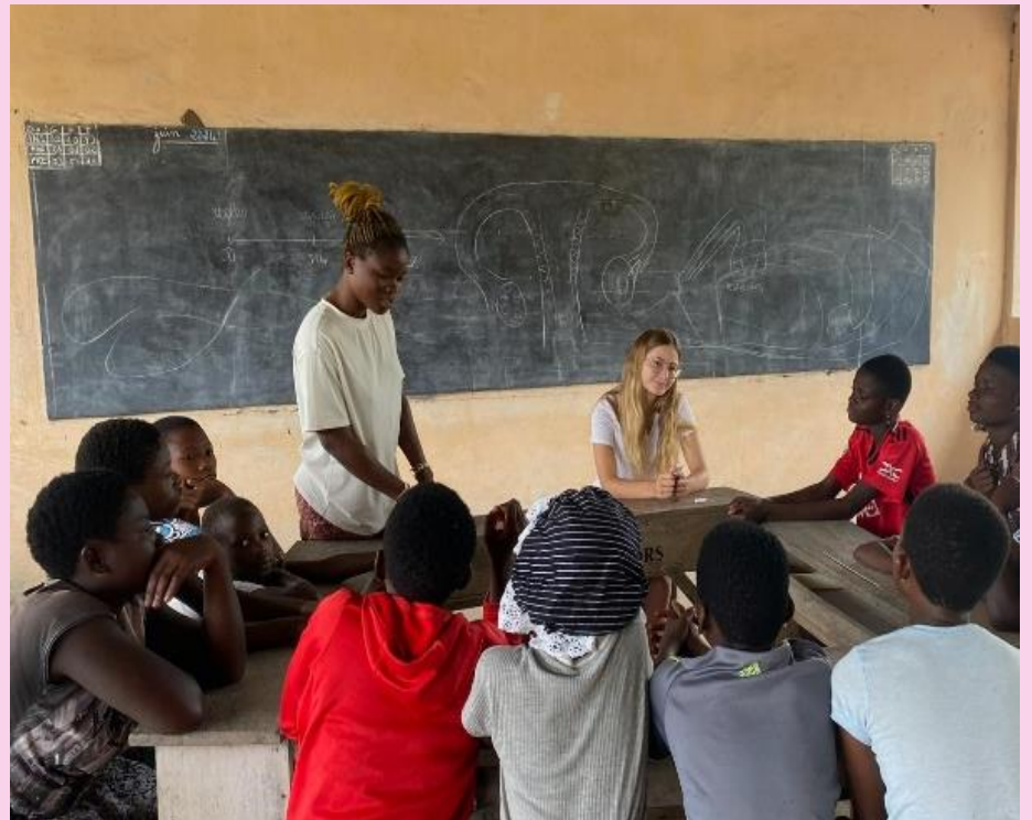
Sensibilisations sur les IST